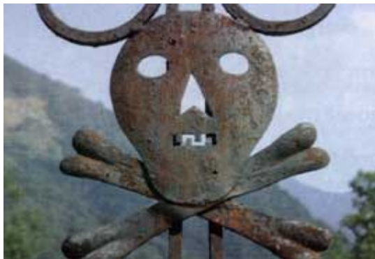
I Sør-Sveits var hodeskallen et symbol for fare og et tegn for vern mot naturkreftene (etter Møllerhaug 2003:12).

I Dag og Tid lørdag 9 august 2003 er vi presentert for et bygde-Norge som et langstrakt Twin Peaks som holder på å gro igjen. Den klare motsetning er det turistperfekte Heidi-landet Sveits med glade kyr og grunneierlag som eier alt i fellesskap og har et felles ansvar for at bygdas kulturlandskap kan ivaretas gjennom vedlikehold av driftsformene i landbruket. Overalt i alpefjellene i Sør-Sveits finnes det spor fra fortiden på husvegger, langs stier og i utmark. Det er etterlevninger fra generasjoner som har opplevd hungersnød, sprengkulde, isolasjon, og drap. Det er knyttet legender til tegn som minner folk om hendelser i landskapet. Alpene er fylt av kulturmiljøer med menneskeskapte merker som tas vare på for å gjøre det mulig for folk å huske farene og forstå nødvendigheten av å kunne lese landskapstegnene ikonografisk. Vi står overfor en kulturell overlevelsesstrategi og tradisjonsoverføring i forhold til naturen, en særlig type kulturforståelse som er utviklet med tanke på framtidens generasjoner. I Norge har vi flere typer medforvaltere som aktører og brukere av landskap. Vi har et statlig, fylkeskommunalt og kommunalt organisert hierarki med et byråkrati som skal ivareta fellesverdiene i landskapet for allmennheten. Hvordan forstår aktører og brukere forvaltningen av landskapet, og hvordan er det med overlevelsesstrategien og tradisjonsoverføringen av kulturforståelse som muliggjør felles lesning av landskapet for de neste generasjoner?