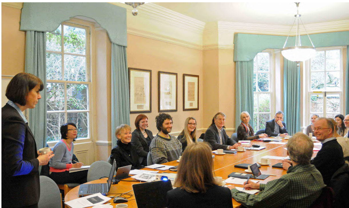
Kunnskapssenteret på besøk hos samarbeidspartner Oxford University Centre for Educational Assessment (OUCEA)