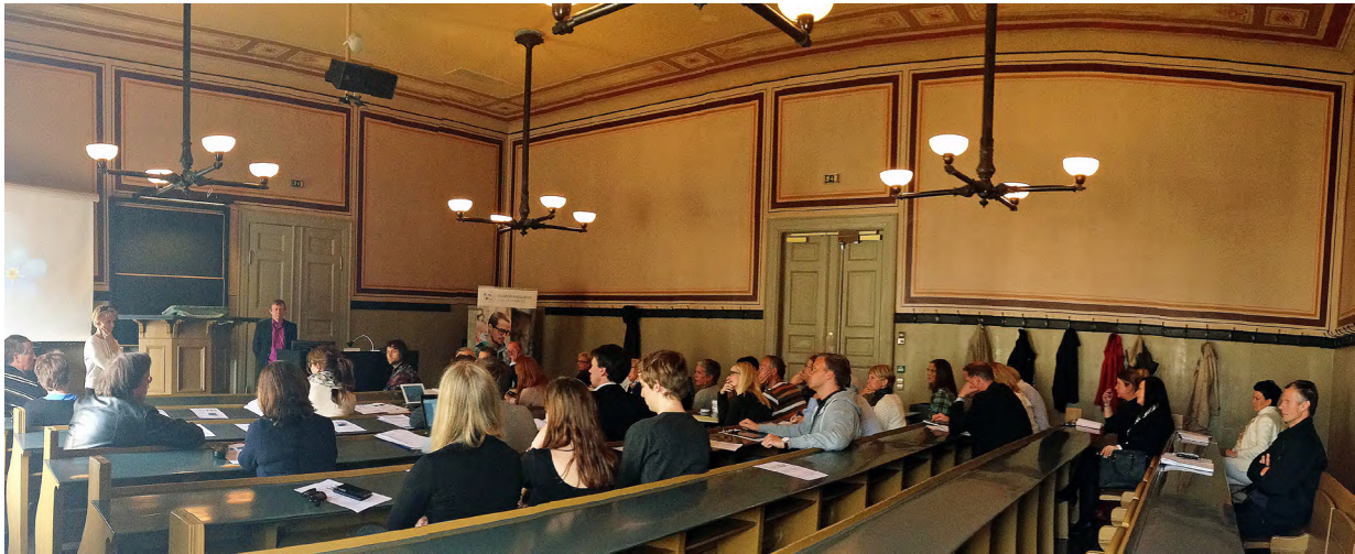
Kunnskapssenteret presenterer den nye systematiske kunnskapsoversikten om forskning på lærervurdering ved Universitetet i Oslo.

definert, men består av flere faktorer som virker sammen. Forskningen anbefaler også økt oppmerksomhet om holdninger til mobbing, for det rapporteres om tilfeller da skolens personale betrakter mobbing som et mindre problem, mens elevene oppfatter det som alvorlige problemer. Et hovedfunn i oppsummeringen er at stadig flere forskere nå er enige om at langsiktig og bredt anlagt arbeid med skolemiljø er det beste tiltaket for å forhindre mobbing og uønsket atferd i skolen. Et utviklingstrekk i forskningen er en bevegelse fra en reaktiv mot en preventiv holdning til mobbing, og fra et individperspektiv til økt forståelse av mobbingens kontekst og gruppedynamikk. En mer inkluderende skole kan motvirke et bredt spekter av tilpasningsproblemer.