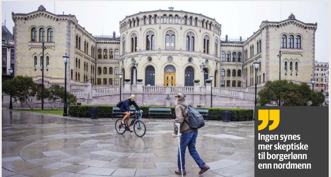
Med ny teknologi får vi ikke bare roboter, vi får et nytt arbeidsliv preget av mer usikkerhet, mer kortsiktighet og større lønnsforskjeller. Vi kan føre en arbeidslivspolitik som kjemper mot disse trendene, men jeg er redd vi er dømt til å tape.

Det er to gjennomgripende samfunnstrender som vil utfordre arbeidslinjen. Den første handler om arbeidsmarkedets karakter. Den andre