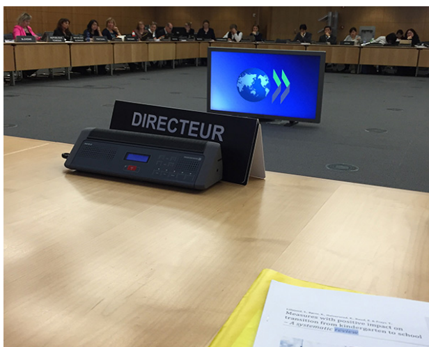
Fra presentasjon av Barnehagerapporten for OECD i Paris.

22. sept: Kunnskapssenteret arrangerte et Kunnskapsparlament i samarbeid med ProTed med temaet "Integrerte studiedesign. Hvordan skape helhet og sammenheng i læreres profesjonsutdanning?" på Litteraturhuset i Oslo.