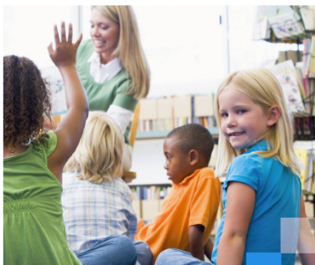
Rapporten om overgang fra barnehage til skole.

LILLEBØ, S., BØRTE, K., HALDORSSON, K., RUD, E. & FREYE, T.